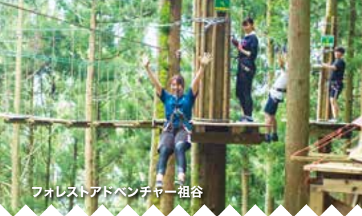
フォレストアドベンチャー 祖谷