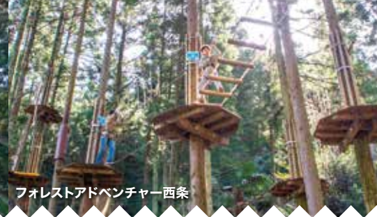
フォレストアドベンチャー 西条