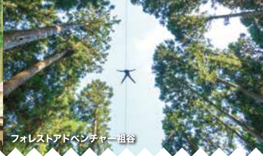
フォレストアドベンチャー 祖谷